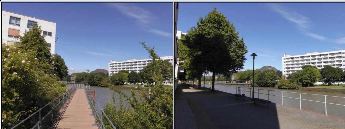
Fotos: Direkt in der Innenstadt beginnt der landschaftlich sehr reizvolle Geestewanderweg.

Es muss nicht immer ein großer Ausflug sein. Auch im eigenen Stadtteil gibt es vielleicht schöne Ecken, die Sie schon lange nicht mehr besucht haben.