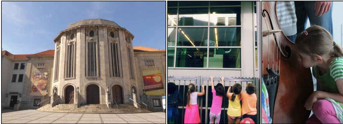
Fotos: links: Außenansicht des Stadttheaters; rechts: theaterpädagogisches Angebot

Adresse: Am Alten Hafen 25, 27568 Bremerhaven (Mitte-Süd) Telefon Theaterkasse: 0471/49001 www.bremerhaven.de/de/leben-arbeiten/familien-kinder/familienportal/stadttheater-bremerhaven.78584.html