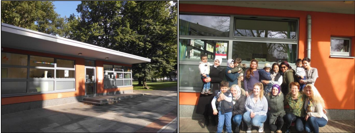
Fotos: Das Familienzentrum bietet zahlreiche Aktivitäten für Eltern und Kinder verschiedenen Alters.