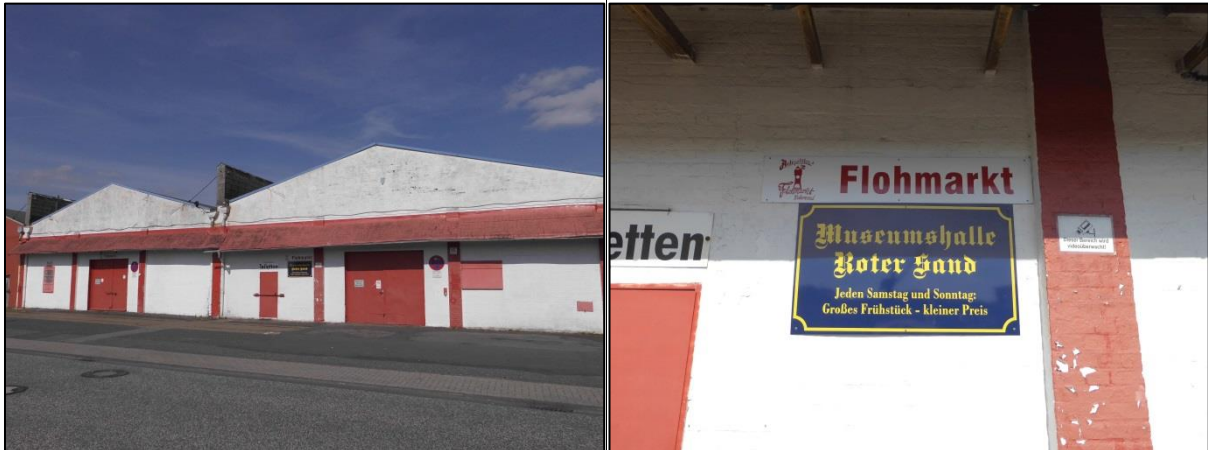
Fotos: In den Flohmarkthallen und auf dem Außengelände finden gutbesuchte Flohmärkte statt.

Adresse: Rudloffstraße 113, 27568 Bremerhaven (Mitte-Nord) https://www.bremerhaven.de/de/leben-arbeiten/familien-kinder/familienportal/flohmarkt-rotersand.78669.html