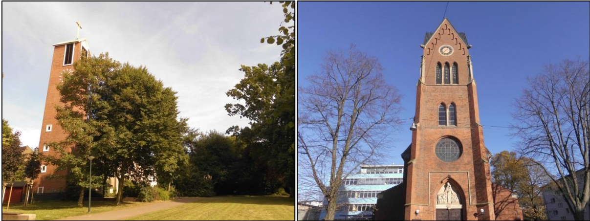
Fotos: links: die ev.-luth. Kreuzkirche; rechts: der Kirchturm der katholischen Marienkirche