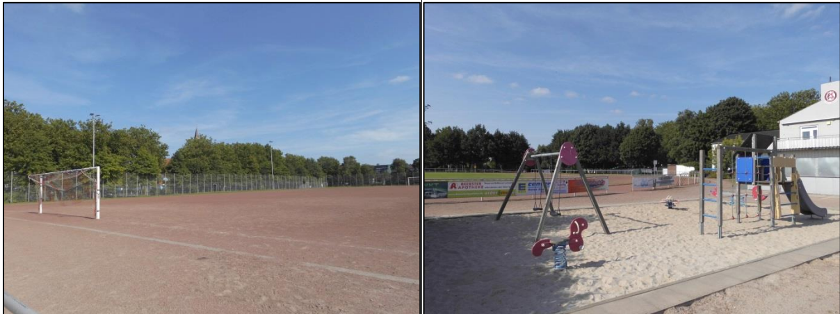
Fotos: Sport- und Spielplätze des FSC

www.bremerhaven.de/de/leben-arbeiten/familien-kinder/familienportal/sport-fussball-club-sparta-bremerhaven-von-1901-e-v-fsc.78333.html