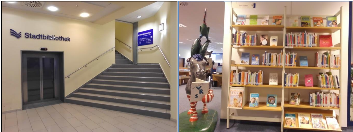
Fotos: links: Ausgang zur Stadtbibliothek; rechts: Regal mit Büchern zum Thema „Eltern und Kind“