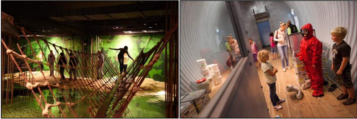
Fotos: links: Hängebrücke in „Kamerun“, rechts: „Antarktisstation“