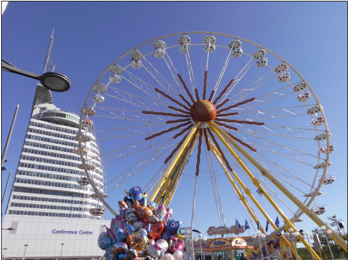
Foto: Riesenrad und Luftballonverkauf beim SeeStadtFest