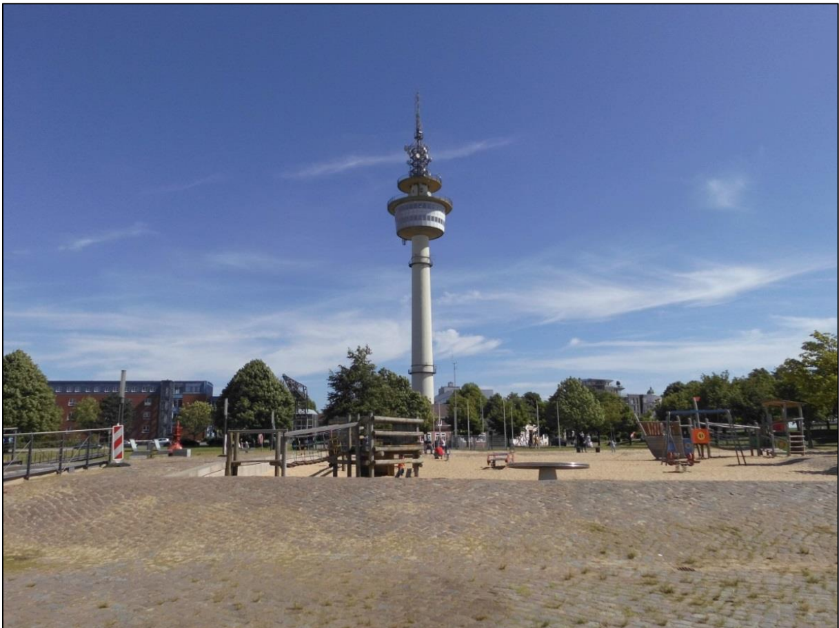
Foto: Der Radarturm. Im Vordergrund: Der beliebte Spielplatz am Schiffahrtsmuseum.

www.bremerhaven.de/de/leben-arbeiten/familien-kinder/familienportal/aussichtsplattform-auf-dem-radarturm-bremerhaven.78599.html