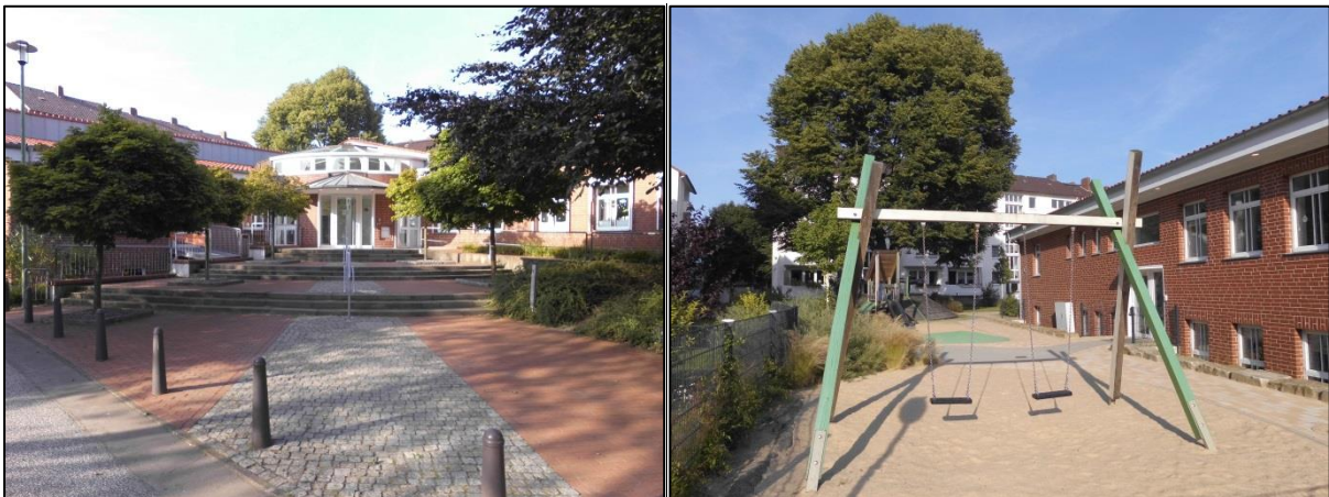
Fotos: Eingangsbereich der neuen Krippe in der Dresdener Straße. Links: der Spielplatz der Krippe.