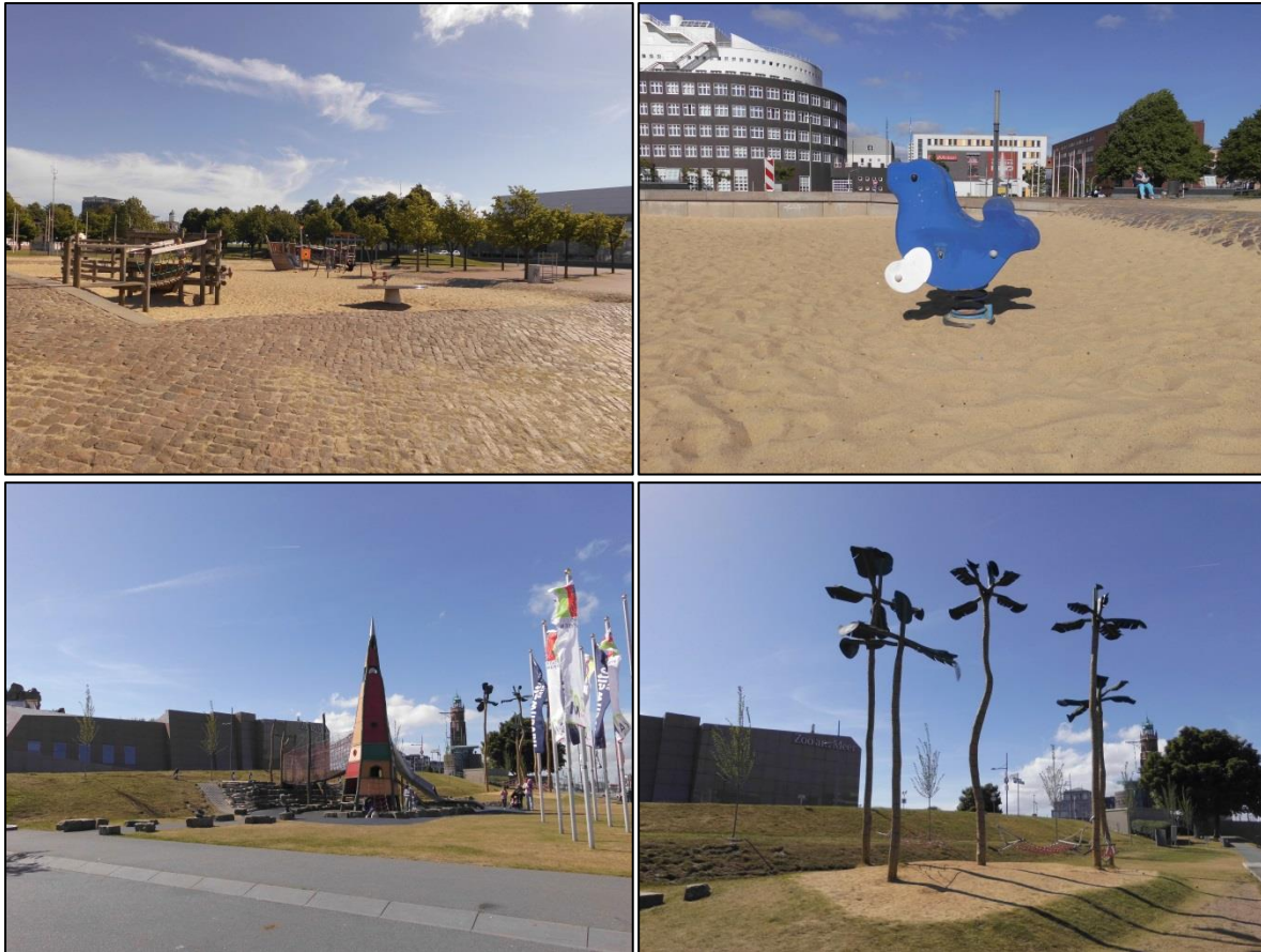
Fotos oben: Spielplatz am Schifffahrtsmuseum; Fotos unten: Spielplatz vorm Zoo

Hinzu kommt ein Spielplatz im kostenpflichtigen Weser-Strandbad (siehe unten).