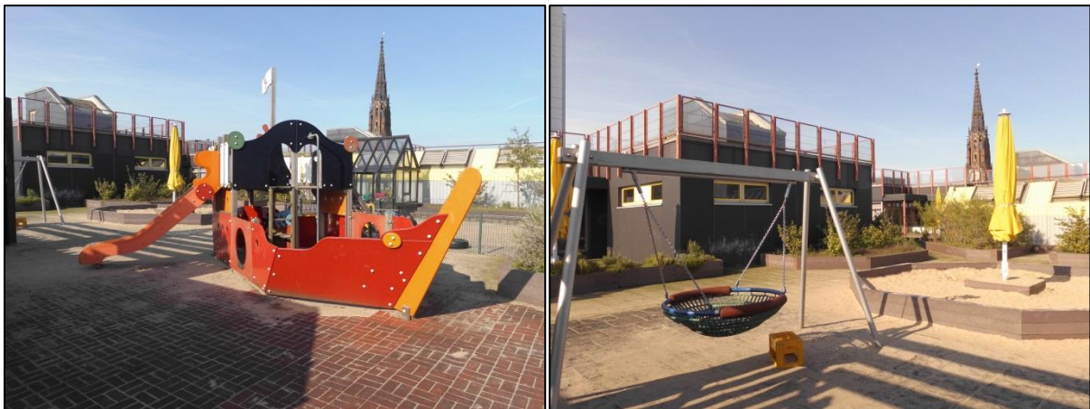
Fotos: das Außengelände der Kita Columbus Center