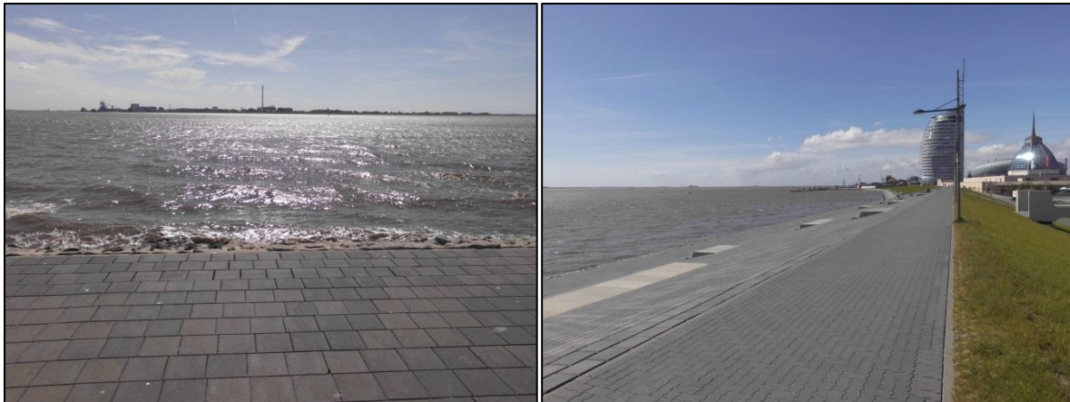
Fotos: links: Blick von der Deichpromenade auf die Weser; rechts: Teil der Deichpromenade